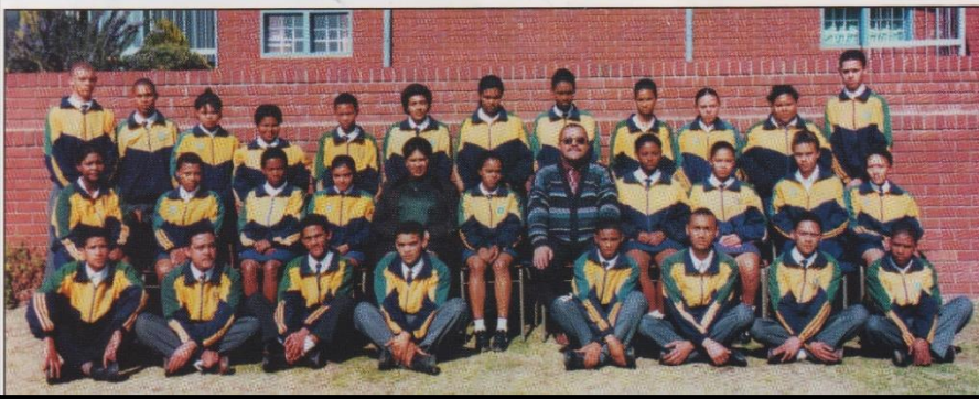
Eerste matriekklas 1998